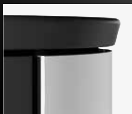
Forma a clessidra parte superiore