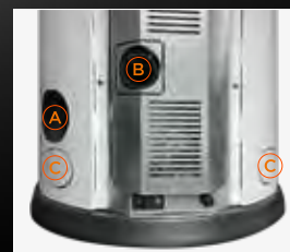
A Uscita fumi B Entrata aria comburente C Uscita Canalizzazione