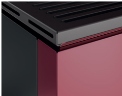
Dettaglio finitura angolo