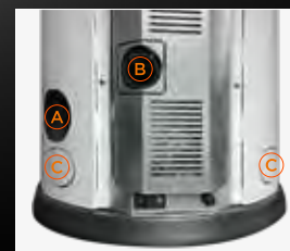
A Sortie Fumées B Entrée air de combustion C Sortie de canalisation