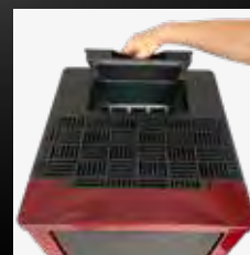
Réservoir granulés 22 kg