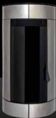
METALLO SPAZZOLATO Métal Brossé