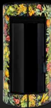
CERAMICA NERA Céramique Noire