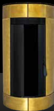
OTTONE SPAZZOLATO Laiton Brossé