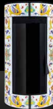
CERAMICA BIANCA Céramique Blanche