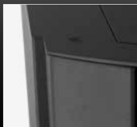
Couvercle et côté