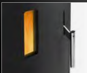
Vue du feu et poignée