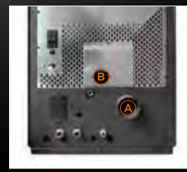
A Sortie fumées postérieure B Entrée air de combustion