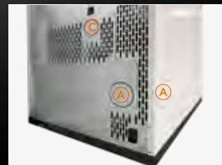
A Sortie fumées postérieure Sortie de fumées latérale optional C Prédiposition à la canalisation