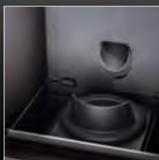
Brasero en fonte