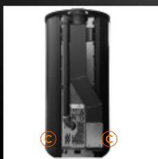
Echappement Coaxial Poujolat C Sortie de canalisation