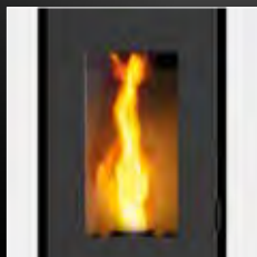
Porte en une seule pièce