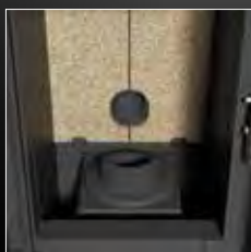
Brasero interne en fonte