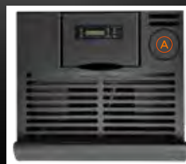
A Pr edisposition sortie fum ees sup erieures