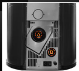
A Sortie Fumées B Entrée air de combustion