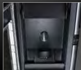
Brasero INOX 316