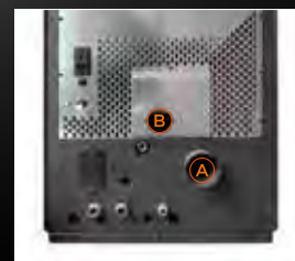
A Uscita fumi posteriore B Entrata aria comburente