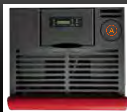
A Predisposizione uscita fumi superiore