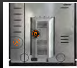
A Uscita fumi posteriore B Entrata aria comburente