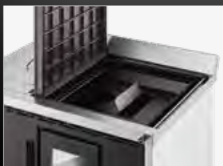
Apertura piastra superiore per pulizia