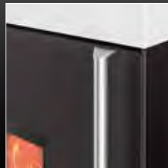
Maniglia inox satinato