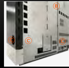
B Entrata aria comburente C Uscita Canalizzazione