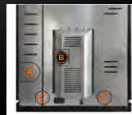
A Uscita fumi posteriore B Entrata aria comburente C Predisposizione alla canalizzazione