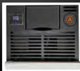
A Predisposizione uscita fumi superiore