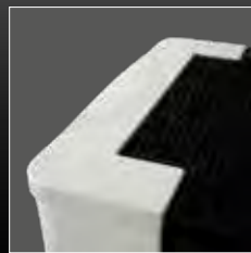
Top in ceramica