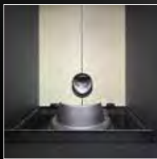
Braciere in ghisa