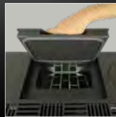
Serbatoio pellet 26 kg