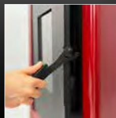
Maniglia in gomma siliconica antiscottatura