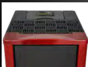
Display e top in ceramica