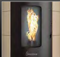
Ampia vista fuoco