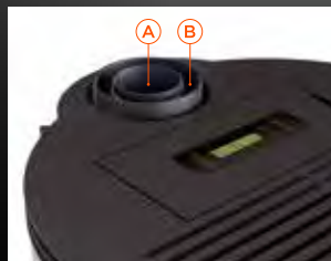
Scarico Coassiale Poujoulat A Uscita fumi B Entrata aria comburente