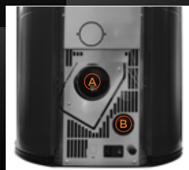
A Uscita fumi B Entrata aria comburente