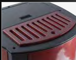
Coperchio in maiolica

Questa versione di idrostufa conserva dimensioni e funzionalità del modello base aumentando la potenza termica. Una macchina molto performante con una capacità di riscaldamento maggiorata che si nasconde sotto le vesti di un'idrostufa dal design tradizionale diventando protagonista nel ruolo di elemento d'arredo. Eccellente dal punto di vista tecnico, ottimizza i costi di riscaldamento e produzione acqua calda sanitaria, integrandosi facilmente in tutti gli ambienti domestici.