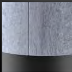
Finitura in marmo serpentino