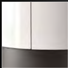
Finitura in ceramica bianca