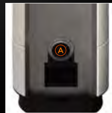
A Uscita fumi posteriore