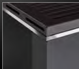
Dettaglio profili cromati