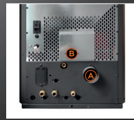
A Uscita fumi posteriore B Entrata aria comburente