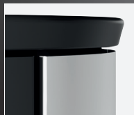
Forma a clessidra parte superiore