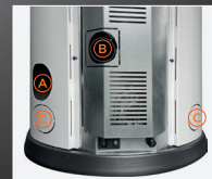
A Uscita fumi B Entrata aria comburente C Uscita Canalizzazione