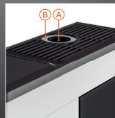
A Uscita fumi superiore B Entrata aria comburente