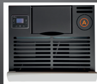
A Predisposizione uscita fumi superiore