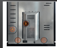
A Uscita fumi posteriore B Entrata aria comburente C Predisposizione alla canalizzazione