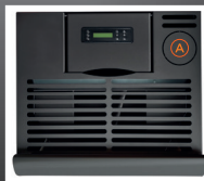
A Predisposizione uscita fumi superiore