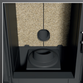
Braciere interno in ghisa