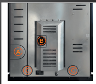
A Uscita fumi posteriore B Entrata aria comburente C Predisposizione alla canalizzazione