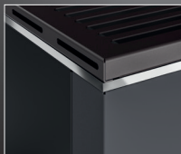
Dettaglio profili cromati