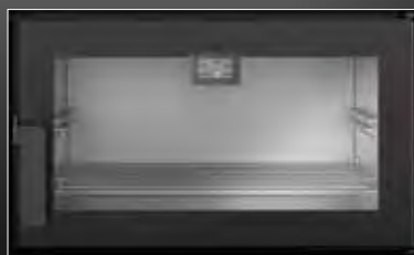
Maxi-oven die een temperatuur van 230°C kan bereiken.