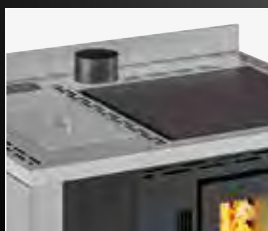
Optionele rookgasafvoer aan de bovenkant