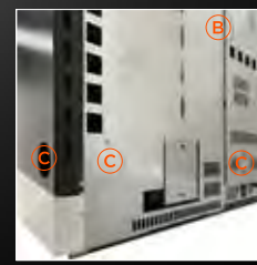
B Verbrandingsluchtinlaat C Kanalisanieuitgang