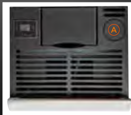
A Mogelijkheid voor rookvoer aan de bovenkant