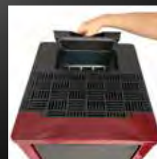
Pelletbak met een inhoud van 22 kg