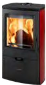
Metallo Rosso opaco