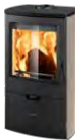
Metallo Tortora opaco