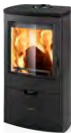
Metallo Nero opaco