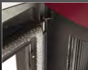
Deur en afdichting