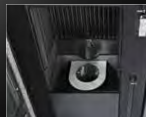
Brander van RVS 316