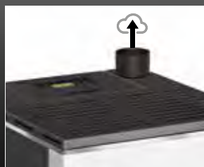
Uitvoering SOFIA 9 .0 UP met rookafvoer bovenkant