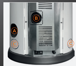
A Rookafvoer B Verbrandingsluchtinlaat C Kanalisatieuitgang