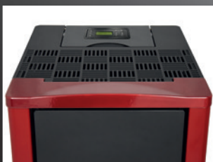
Scherm en keramisch bovenblad