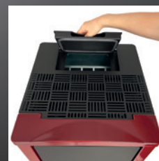
Pelletbak met een inhoud van 22 kg