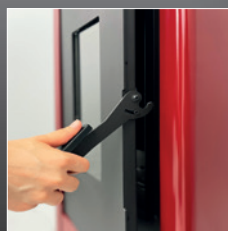
Rubberen handgreep siliconen koudgreep