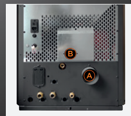
A Rookafvoer achterkant B Verbrandingsluchtinlaat