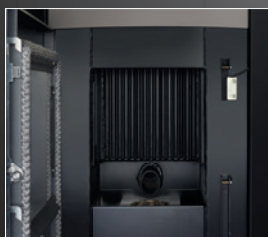
Gestreepte stookruimte met hoge uitwisseling