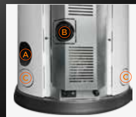
A Sortie des fumées B Entrée d'air de combustion C Sortie de canalisation