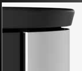
Forme de "sablier" dans la partie supérieure