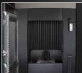
Foyer rayé à haut transfert de chaleur