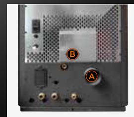
A Sortie postérieure des fumées B Entrée d'air de combustion