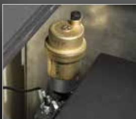
Vanne de sécurité