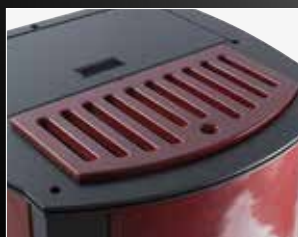
Détail habillage en majolique