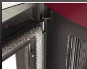
Porte et joint