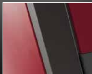
Détail habillage en acier