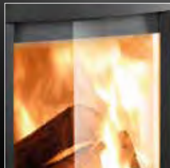
Porta in vetro ceramico