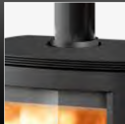
Uscita fumi superiore