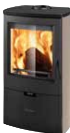
Metallo Tortora opaco