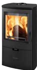
Metallo Nero opaco