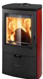
Metallo Rosso opaco