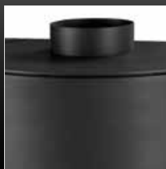
Uscita fumi superiore