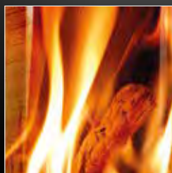
Focolare in vermiculite alta densità