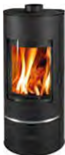
Metallo Nero opaco