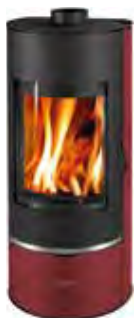
Metallo Rosso opaco