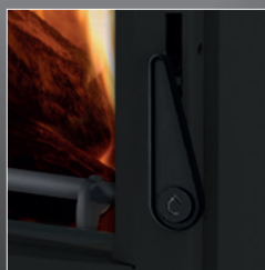
Maniglia anti scottatura