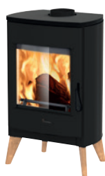
Metallo Nero opaco