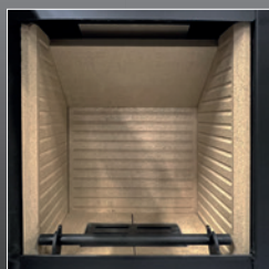
Focolare in vermiculite alta densità