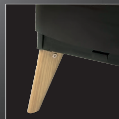
Piedini in legno