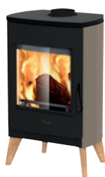
Metallo Tortora opaco