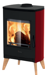
Metallo Rosso opaco